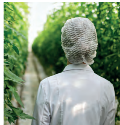
Indossare indumenti monouso puliti