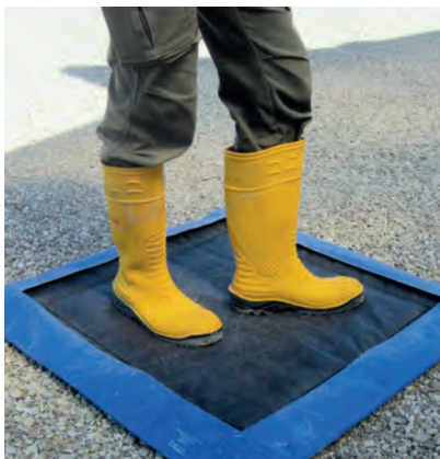
Tappetini imbevuti di disinfettante