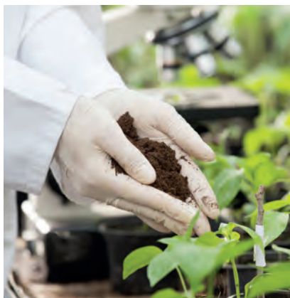
Usare guanti nuovi o disinfettati